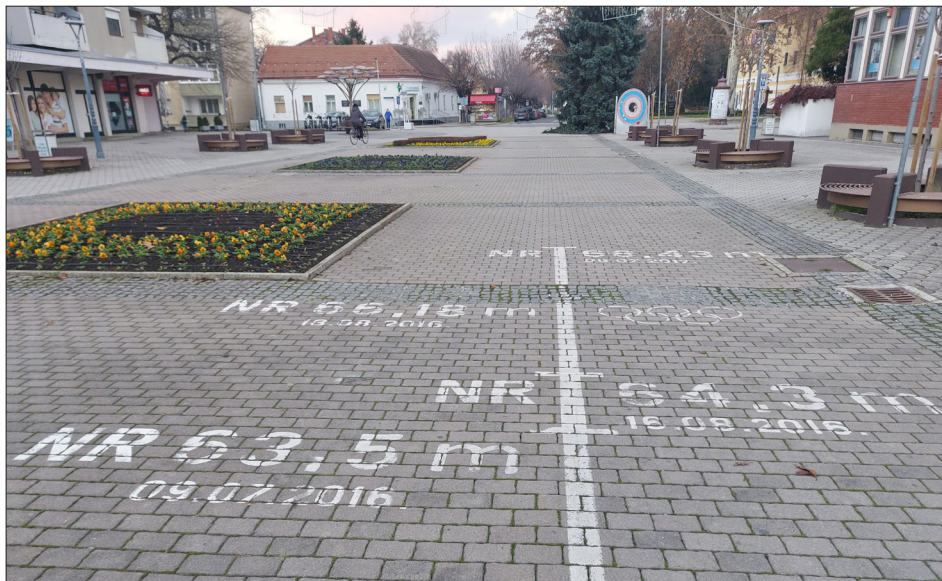
Rezultati Sare Kolak ispisani su na pločniku glavnog ludbreškog trga